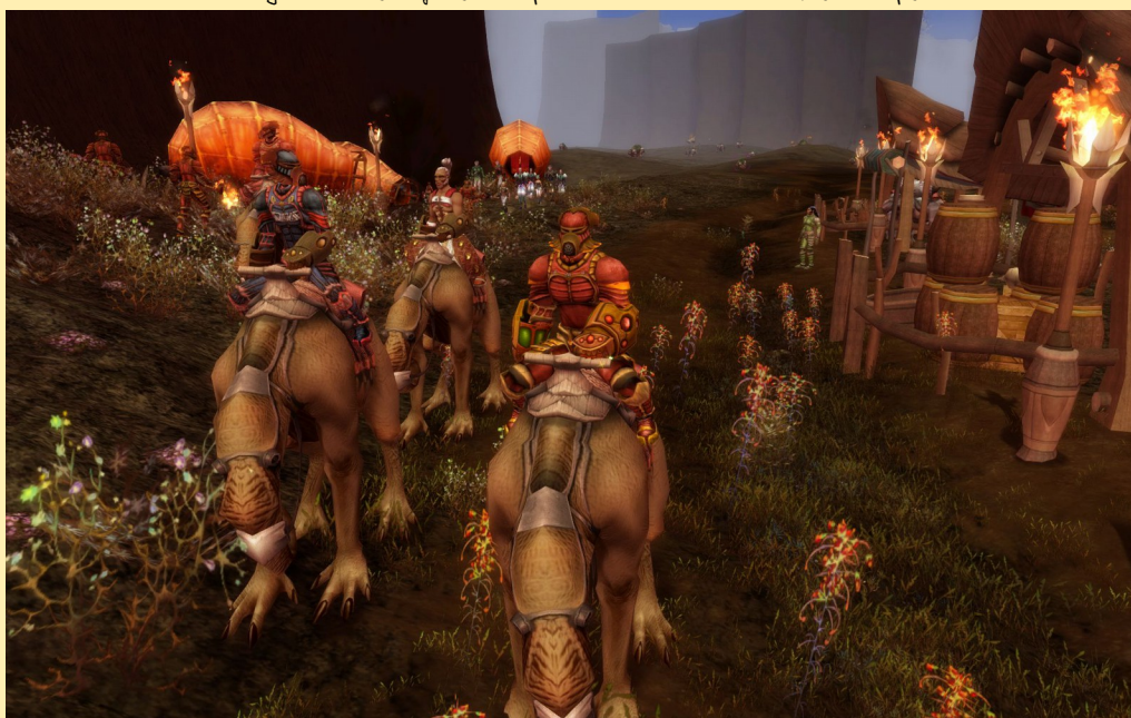
Légionnaires fyros en plein ravitaillement des camps