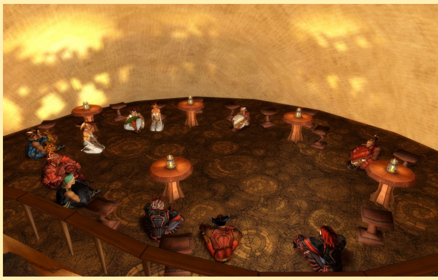
Xaneos en premier plan, lors de la sortie de la réunion